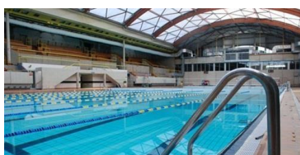
Piscine Georges Vallerey 148 avenue Gambetta 75020 Paris - France

Le Meeting se déroule dans la Piscine Georges Vallerey, construite à l'occasion des Jeux Olympiques de 1924. Elle est équipée d'un bassin de 50m x 21m, 8 lignes.